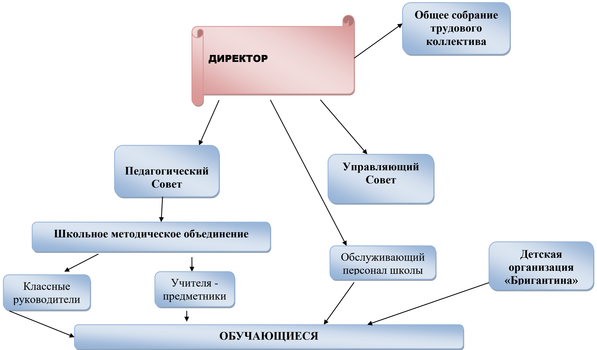
Схема системы управления «Троицкая ООШ, филиал МБОУ «Усть-Пристанская СОШ имени А.М. Птухина»